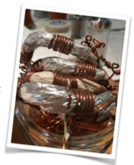
Keshes Plasma Generatoren

Neben Vorträgen über Wasser-vitalisierung durch elektrische Trennung von Basen und Säuren und einem Vortrag über Hyperschallwellen ( www.walter-thurner.de ), fand auch das Thema „ Gc-MAF “ großes Interesse beim Publikum. Das körpereigene Gc- Protein aktiviert die Makrophagen (Fresszellen der Immunabwehr), wenn dieser Stoff injiziert wird.